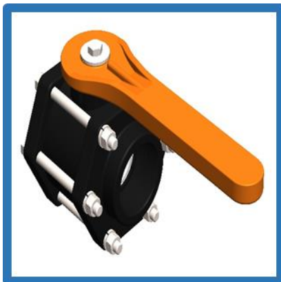
VALVULA FULL PORT 2"- BANJO - USA