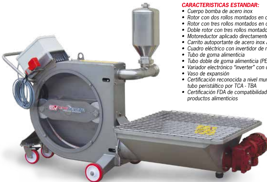
PEV 280+ tramoggia